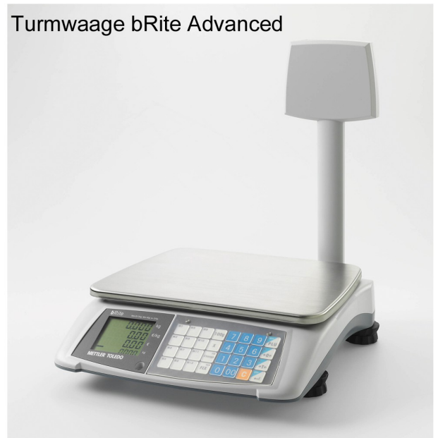
Turmwaage bRite Advanced

Die bRite Advanced besteht aus gestanzten Teilen mit einem stabilen Rahmen und einer grossen und robusten Edelstahl-Wägeplatte für das einfache Wägen grösserer Artikel. Der hochwertige Edelstahl ist wasserbeständig und kann leicht hygienisch sauber gehalten werden - ein entscheidendes Kriterium in punkto Lebensmittelsicherheit. Optionale Abdeckungen sowohl für die Wägeplatte als auch für das gesamte Gehäuse bieten zusätzliche Schutzmöglichkeiten. Durch die Möglichkeit, die Waage mit wiederaufladbaren NiMH-Akkus oder Standardbatterien vom Typ D zu betreiben, ist der mobile Einsatz immer und überall möglich.